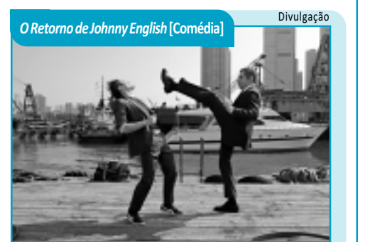
O Retorno de Johnny English [Comédia]

OS SMURFS (The Smurfs, EUA/Bélgica, 2011). Gênero: Duração: 105 min. Classificação: Livre. Dublado e legendado. Direção: Raja Gosnell, com Neil Patrick Harris, Alan Cumming, Katy Perry, George Lopez, Sofia Vergara. Gargamel descobre o povoado mágico dos Smurfs e faz com que eles se dispensem na floresta. Na fuga, eles entram na gruta proibida que os leva para o Central Park. Eles tentam voltar para casa são ajudados por um casal. CinEspace 4: 14h.