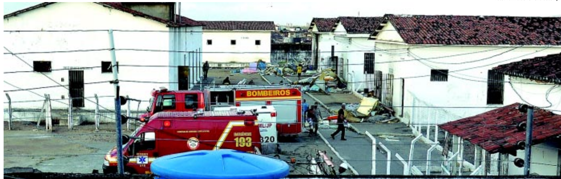
Administração Penitenciária abriu inquérito policial e sindicância para apurar rebelião do presídio, que deixou três pavilhões incendiados e várias celas destruídas

Uma rebelião no Presídio do Roger, na Capital, resultou em dois mortos, 13 feridos, três pavilhões incendiados e várias celas destruídas. O fato ocorreu nos pavilhões 2, 3 e 4 no momento em que familiares faziam visitas. O motivo foi a rivalidade entre duas facções criminosas que disputam o comando do tráfico de drogas. A Administração Penitenciária abriu inquérito e sindicância para apurar o tumulto. PÁGINA 9