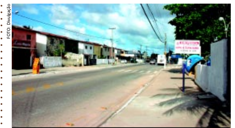
Têm início hoje as comemorações pelos 27 anos de fundação do bairro Valentina Figueiredo, em João Pessoa. A programação festiva segue até o próximo domingo, com o tema "Valentina, viva este bairro". Música, parques e comidas típicas animam o evento.