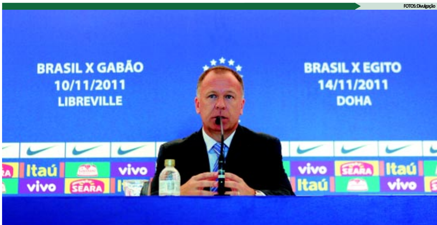
O técnico Mano Menezes preferiu não chamar os jogadores que atuam no Brasil para não prejudicar os clubes na reta final do Brasileirão

Brasil e Gabão ocorre em 10 de novembro, em Libreville, capital local, às 19h (de Brasília). No dia 14, em Doha, no Catar, a seleção fecha a temporada 2011 contra o Egito às 15h.