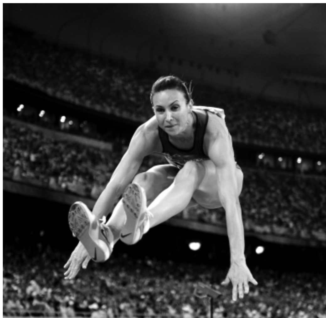
Com sua melhor marca no ano, a saltadora alcançou o terceiro ouro em jogos Pan-Americanos