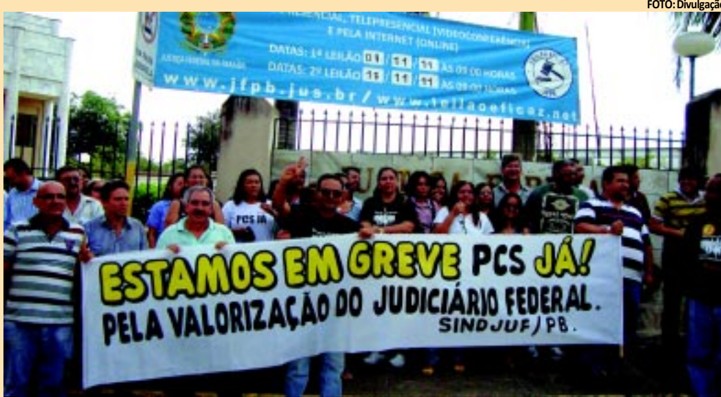
A categoria deve prosseguir com o movimento pelo menos até o dia 9, quando haverá uma ação nacional