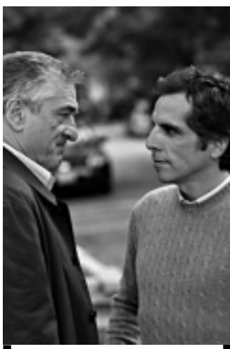
Entrando Numa Fria na Globo