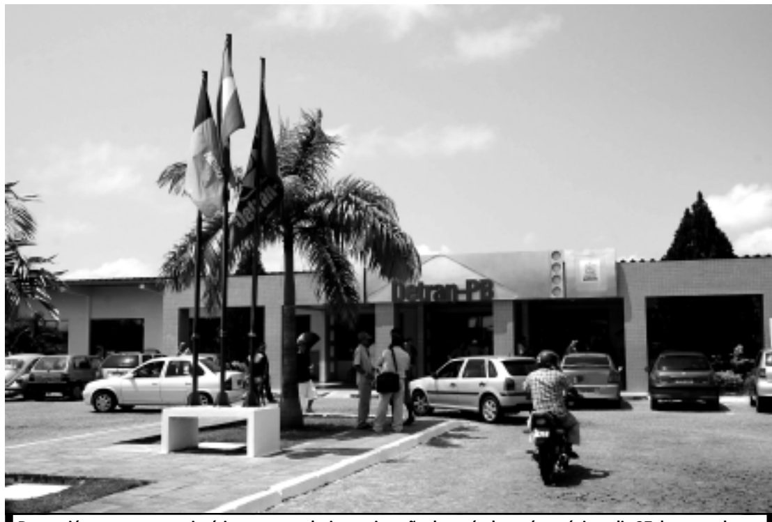
Detran já convocou proprietários para regularizar a situação dos veículos até o próximo dia 27 de novembro

Conforme a estimativa de ocupados por setor de atividade econômica entre os anos de 2001 e 2009, a construção civil foi o que apresentou a maior variação de crescimento - 50,6%, embora a nomenclatura outras atividades tenha superado este perço. Os homens continuam dominando o mercado de trabalho na Paraíba, assim como em todo Brasil, segundo o Anuário do Sistema Público de Emprego e Renda 2010/2011. Eles ocupam 56,8% dos empregos formais no Estado. As mulheres paraibanas, no entanto, conquistaram mais vagas do que a média das nordestinas e das brasileiras. Enquanto na Paraíba, 43,2% têm carteira assinada, no Nordeste a média é de participação delas no mercado de trabalho é de 41,7% e no Brasil 41,6%.