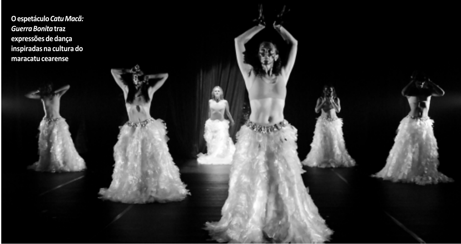
O espetáculo Catu Macã: Guerra Bonita traz expressões de dança inspiradas na cultura do maracatu cearense