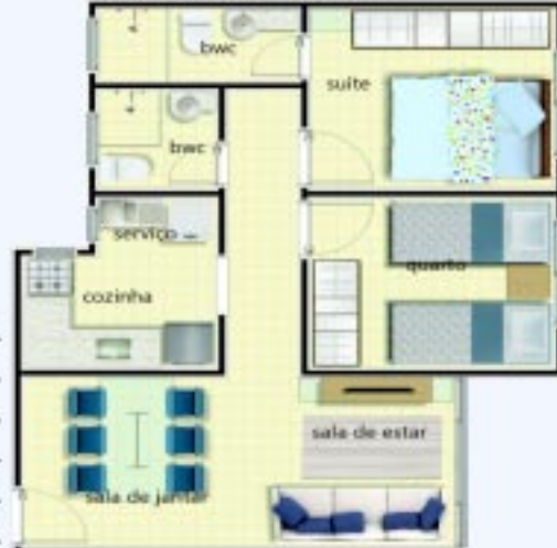
Apartamento tipo 02