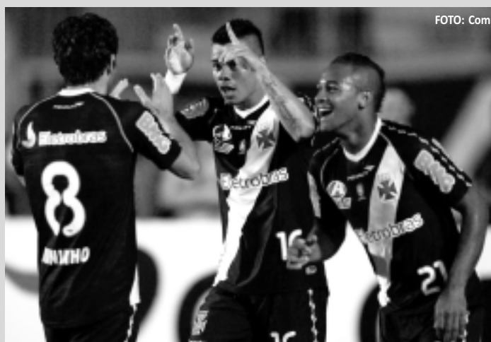
Jogadores do Vasco comemoram mais um gol na vitória de 8 a 3