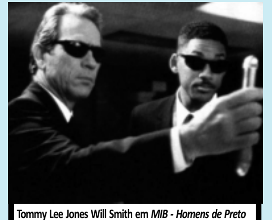
Tommy Lee Jones Will Smith em MIB - Homens de Preto

>>> MIB - HOMENS DE PRETO - O agente K, um dos fundadores da organização secreta MIB, a agência não oficial do governo que controla a imigração secreta de alienígenas, tem uma difícil missão. Ele tem pouco tempo para impedir um ataque alienígena. Para isso, le e seu novo parceiro, o ex-policia J, precisam encontrar os alienígenas terroristas que planejam assassinar representantes de galáxias opostas e destruir o planeta Terra. SE LIGUE: Hoje, às 20h, no A&E