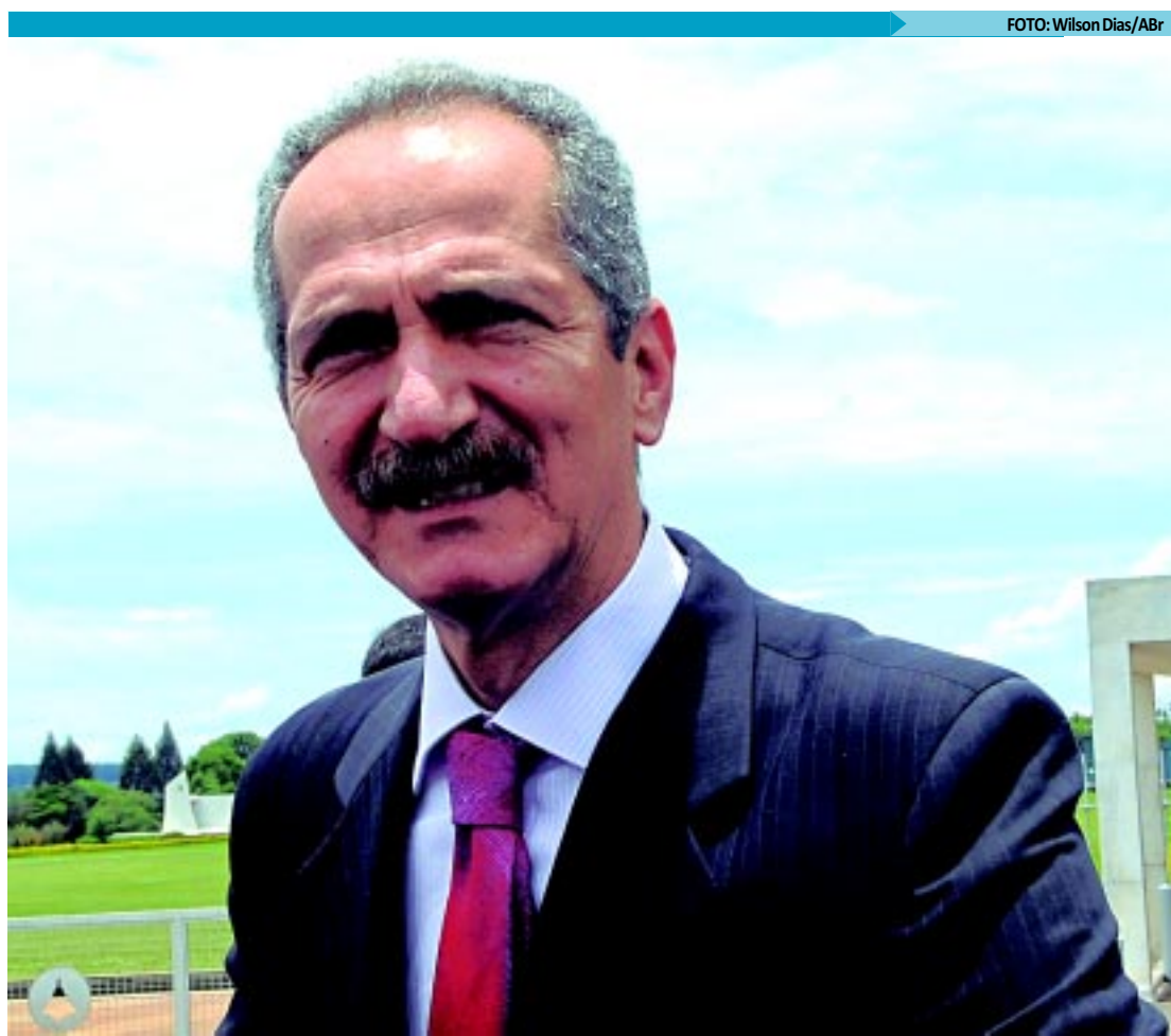
Aldo Rebelo confirmou sua ida para o lugar deixado pelo correligionário no Ministério do Esporte, pela manhã

De acordo com o ministro, as irregularidades estavam ocorrendo porque não havia tradição alguma de convênios com ONGs, nem com prefeituras, "nem com nada no Brasil, até oito anos atrás. Operações, Controladoria, Polícia Federal, é coisa nova. Decreto dando transparência aos convênios é coisa que entrou em vigor em janeiro deste ano."