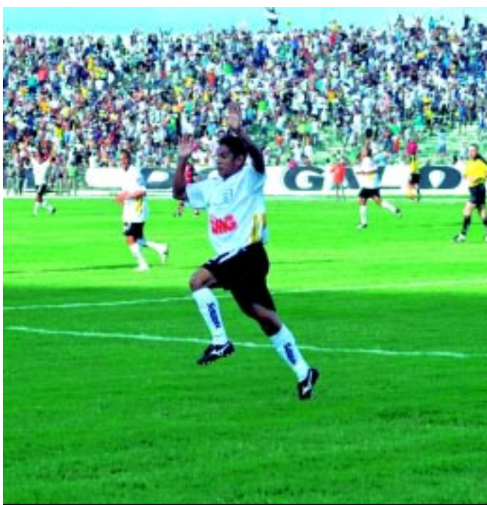
Cléo tem propostas de outros clubes e não confirmou participação