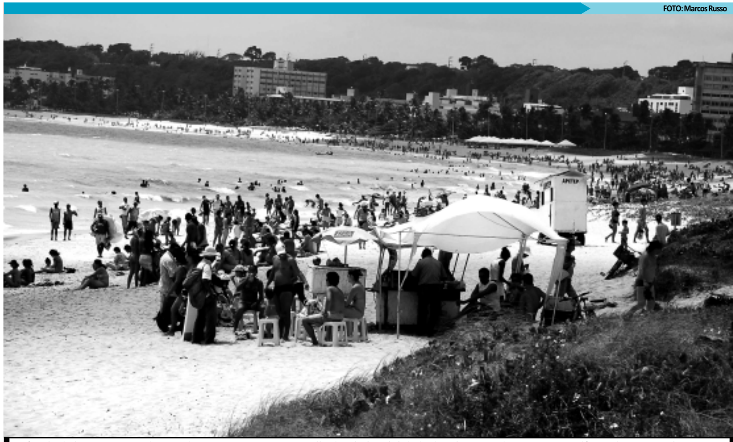
Acúmulo de lixo nas praias da Grande João Pessoa tem atrapalhado a balneabilidade da orla, segundo a Superintendência do Meio Ambiente