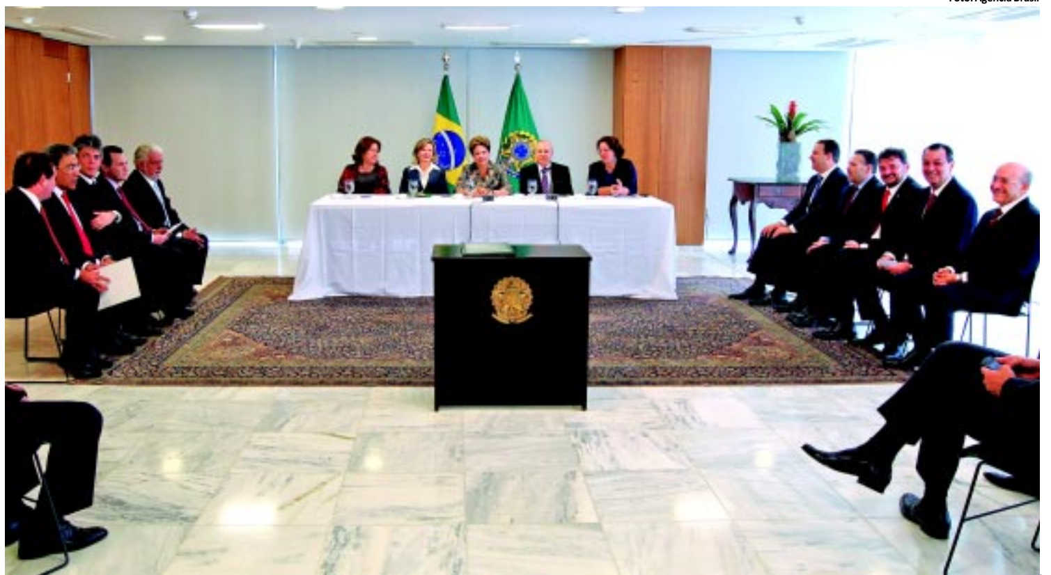
A presidente Dilma Rousseff e o governador Ricardo Coutinho assinaram em Brasília o termo para investimento de R$ 500 milhões na Paraíba

no, onde estão sendo oferecidas 60 vagas, e de Santa Luzia, que abriu 88 oportunidades de emprego. Em Camalaú, as inscrições podem ser feitas até amanhã. PÁGINA 12