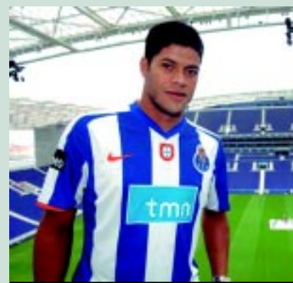
Paraibano é chamado novamente

Bruno César (Benfica) Dudu (Dinamo de Kiev) Elias (Sporting) Hernanes (Lazio) Kaká (Real Madrid) Willian (Shakhtar)