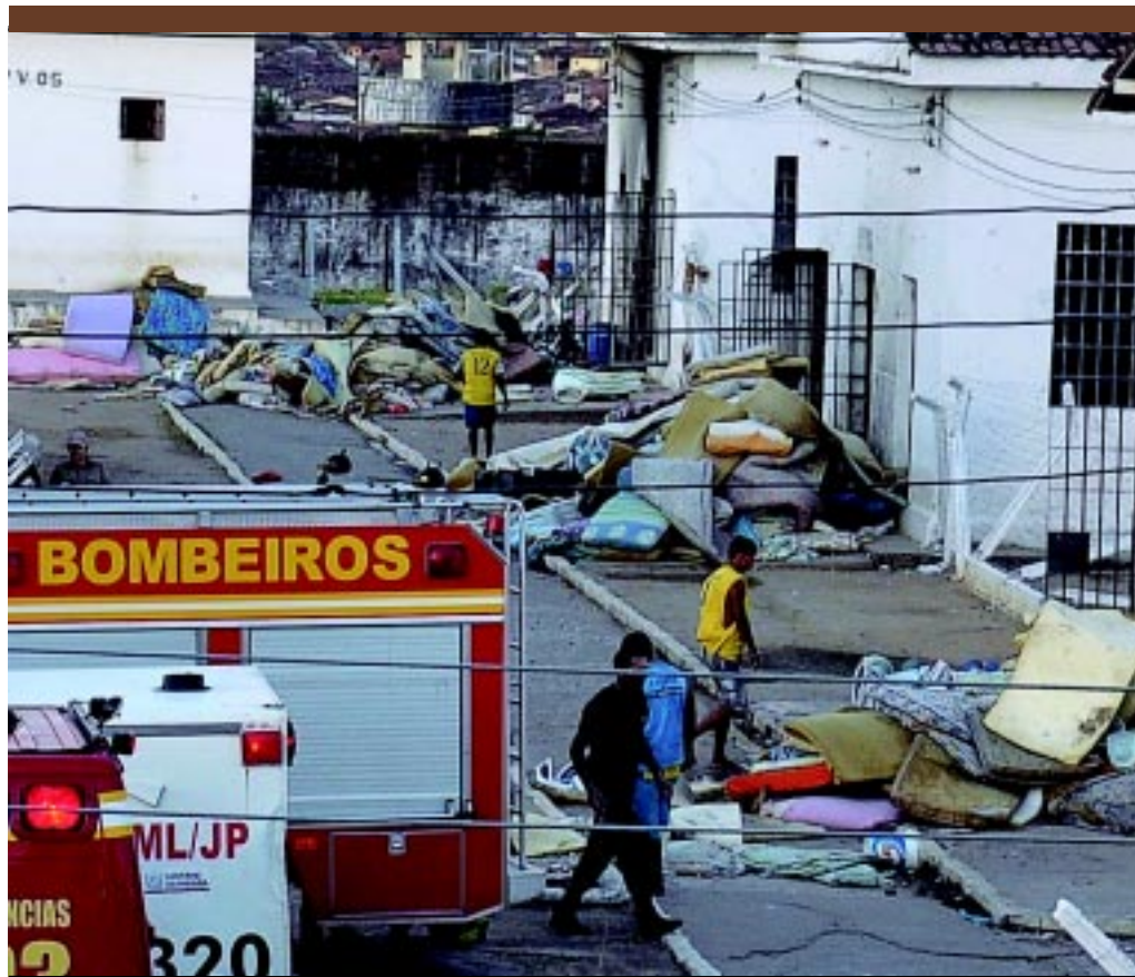
Presos entraram em confronto por volta do meio-dia. Quem estava no interior da unidade entrou em pânico, familiares esperavam notícias em frente ao presídio