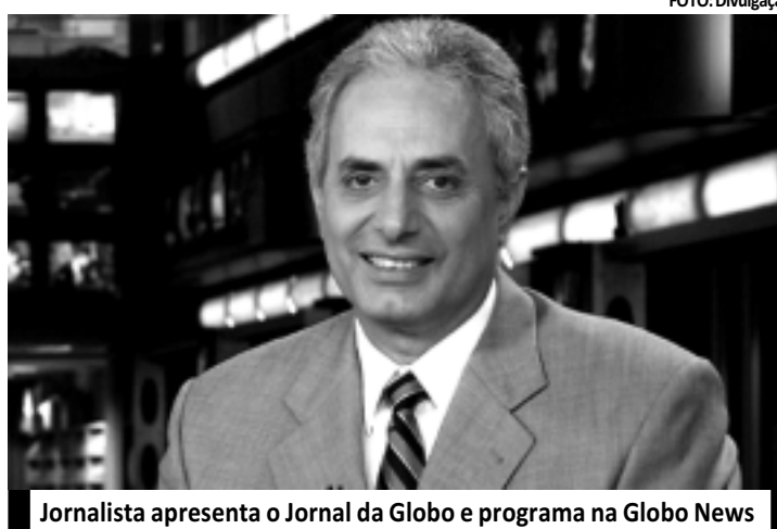
Jornalista apresenta o Jornal da Globo e programa na Globo News

O jornalista da Rede Globo reportou aos americanos em fevereiro de 2010 que um fórum econômico em São Paulo deixou as seguintes impressões sobre os possíveis candidatos à presidência: Ciro Gomes era o mais