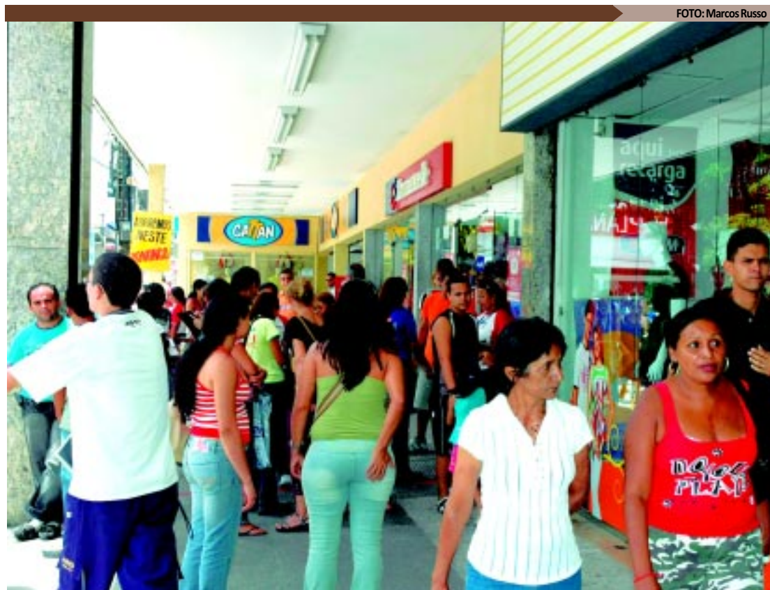
Lojas do comércio varejista apresentam expansão nos negócios dobrada em todos os segmentos em dezembro